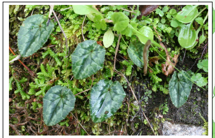
Rosazia le 4décembre 2008

Sa fleur se caractérise par une corolle à 10 dents où apparaissent 5 dessins plus foncés en forme de V qui offrent un joli contraste avec le rose pâle du reste de la fleur.